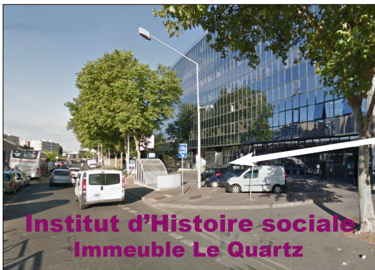
Institut d'Histoire sociale Immeuble Le Quartz

Sortie n°36, puis à ± 80 m, au feu, à gauche dir. Nanterre-Centre et à nouveau à gauche (U-turn)